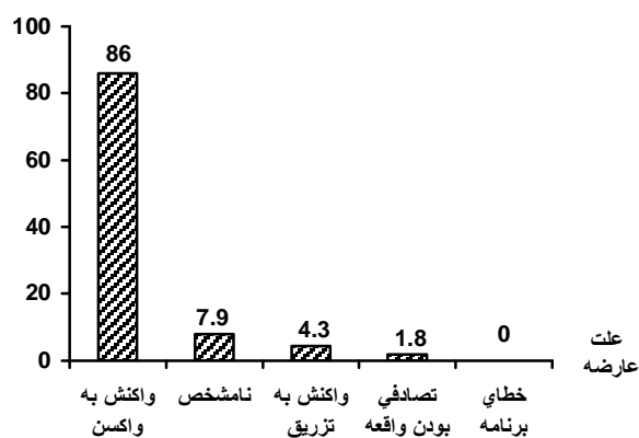
نمودار شماره 2- میزان بروز عوارض ناشی از واکسیناسیون MR بر حسب علت عارضه

در 86% موارد بروز عوارض مربوط به واکنش به واکسن بوده و هیچ موردی از خطای برنامه دیده نشد. (نمودار شماره 2)