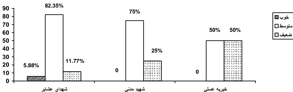
نمودار شماره 3- توزیع فراوانی نسبی منابع و امکانات در خصوص رعایت اصول کلی پیشگیری از عفونتهای بیمارستانی در بیمارستان های آموزشی شهر خرم آباد 84-1383