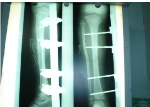
شکل شماره 3- پس از شکستن فیولا و ریداکشن تیبیا

در روز بعد، پس از تهیه وسیله عمل مجدداً شستشو و دبریدمان صورت گرفت و چون اصلاح تدریجی انحنای فیولا موفق نبود مجبور به شکستن فیولا بصورت دستی شدیم تا توانستیم تیبیا را جا اندازی آناتومیک کنیم و با اکسترنال فیکساتور ثابت نماییم.