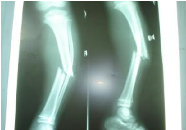
شکل شماره 1- قبل از جا اندازی اولیه

در بدو ورود برای وی در اطاق عمل شستشو و دبریدمان و جاناندازی شکستگی انجام شد که بصورت بسته مقدر نبود لذا بصورت باز سعی در جا اندازی شد ولی جا اندازی کاملاً موفق نبود و پس از عمل در رادیوگرافی انجام شده باز هم منحنی بودن فیولا و واروس دفورمیتی ساق پا وجود داشت (شکل 2).