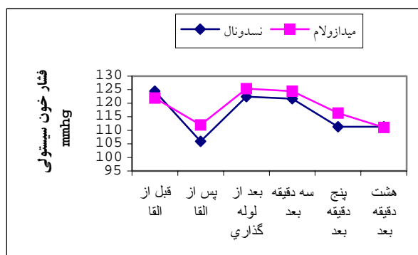
نمودار شماره ۱- تغییرات فشار خون سیستولی در دو گروه تیوپنتون و میدازولام

سرریعی یافت ولی چندان از حد پایه خود فراتر نرفت و این میزان افزایش معنی دار نبود. در ادامه فشار خون در دو گروه به تدریج دچار کاهش نسبی شد که اهمیت آماری نداشت (نمودار ۱).