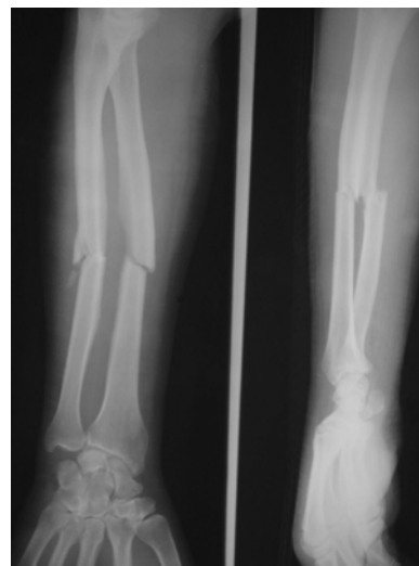
شکل شماره ۱- نمونه ای از شکستگی ها قبل از عمل

البته توانایی در حرکات ظریف دست تا حدی از دست رفته بودند. تمام شکستگی ها در رادیوگرافی در وضعیت مناسب جوش خوردند (شکل شماره ۲).