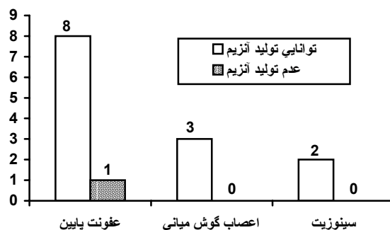
نمودار شماره ۳- فراوانی سویه‌های مولد بتالاکتاماز در بین موراکسلا کاتارالیس های ایزوله شده

بعد از سنجش حساسیت نسبت به آنتی بیوتیکها بر روی سویه‌های مقاوم به پنی‌سیلین حتما باید تست تولید آنزیم بتالاکتاماز صورت گیرد که با انجام این آزمایش به روش نیتروسیفین از ۱۴ مورد ۱۳ مورد توانایی تولید آنزیم بتالاکتاماز را داشته (۹۳٪) و ۱ مورد قادر به تولید آنزیم بتالاکتاماز نبود (نمودار شماره ۳).