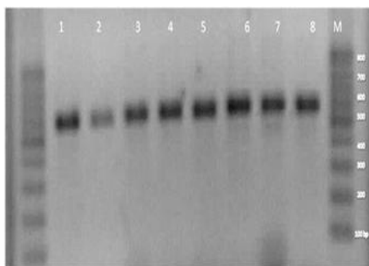
شکل ۱. الکتروفورز افقی محصولات PCR مربوط به گونه‌های مختلف آسپرژیلوس (ستون ۱-۸) شامل موارد ذکر شده در جدول ۱. بدون در نظر گرفتن شیب ژل تقریباً تمامی باندها (ستونهای ۱-۸) با سایز تقریباً یکسان (۶۰۰-۵۰۰ bp) مشاهده می‌گردند.