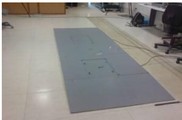
تصویر ۳. دستگاه صفحه نیروی کیستلر