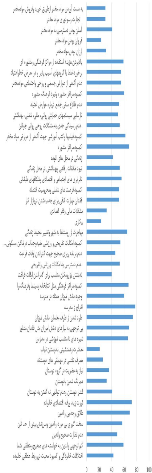
نمودار ۲ - عوامل موثر بر گرایش به مصرف مواد مخدر بر اساس درصد فراوانی

در مطالعه صبا و همکاران شایع ترین اختلال در مصرف کنندگان مواد افسردگی بود که در این مطالعه نیز تأیید شد هر چند افسردگی با ترکیبی از ترس و رفتارهای پرخطر بیشتر به چشم خورد. در مطالعه ای در آمریکا گروه سنی ۱۸ تا ۲۵