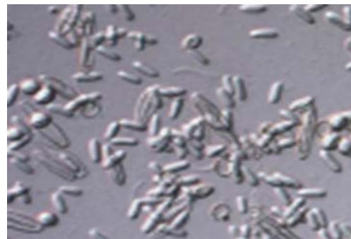
شکل ۳. نماتوسیت های آزاد شده از تنتاکولها با بزرگنمایی ۴۰×۱۰

عروس دریایی R. nomadica را در زیر میکروسکوپ نوری نشان می دهد. در ضمن روش ارائه شده دارای بازدهی مناسبی می باشد (۱۵).