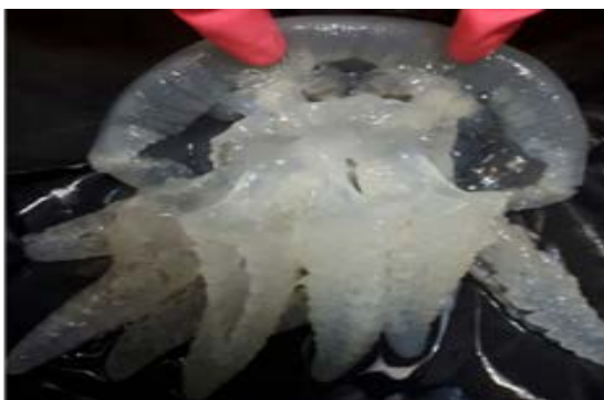
شکل ۲. عروس دریایی R. nomadica

در این تحقیق، نمونه عروس دریایی از نوار ساحلی شمال جزیره قشم نمونه برداری شد و تعداد ۲ عدد نمونه تهیه شده از نظر مورفولوژیک بررسی شد و مشخص گردید نمونه مورد نظر R. nomadica می باشد. (شکل ۲)