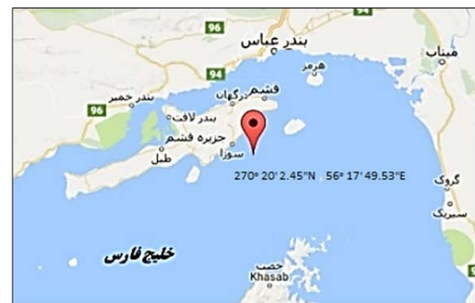
شکل ۱. موقعیت مکانی نمونه برداری عروس دریایی

های جدا شده از قسمت چتری، در یک فالكون ۵۰ میلی لیتری قرار داده شد. به ظرف محتوی تتاکل، به مقدار دو برابر، آب دریا اضافه گردید. ظرف محتوی تتاکل به مدت ۳ روز دریخچال و در دما 4^{\circ}\text{C} نگهداری شد. هر روز در زمان های مختلف به مدت ۱ تا ۲ دقیقه به شدت تکان داده شد تا سلول های نامتوسیت ها از بافت تتاکل جدا شوند. بعد از گذشت این زمان، محلول حاصل، از چهار لایه گاز استریل پزشکی به عنوان فیلتر، عبور داده شد. سپس محلول حاصل، در سانتریفیوژ یخچال دار با ۱۲۰۰۰ دور برای مدت ۲۰ دقیقه، سانتریفیوژ گردید و محلول رویی خارج شد و توسط دستگاه فریزدرایر به پودر خشک تبدیل گردید. پودر حاصل در دمای 20^{\circ}\text{C} - نگهداری شد. این پودر، حاوی نامتوسیت های عروس دریایی می باشد که در داخل آن زهر عروس دریایی قرار دارد.