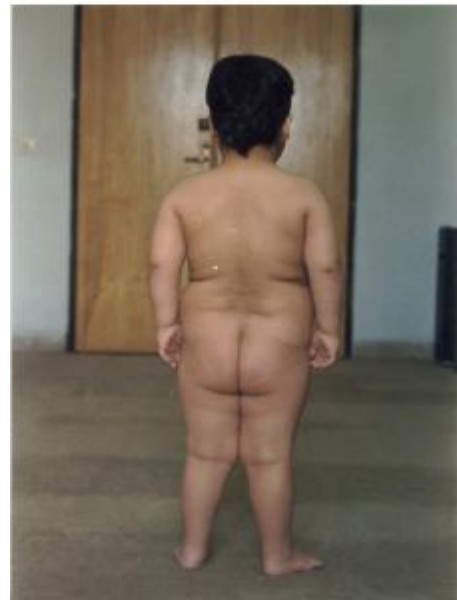
تصویر شماره 1- بیمار، پسر چهار و نیم ساله با الگوی چاقی