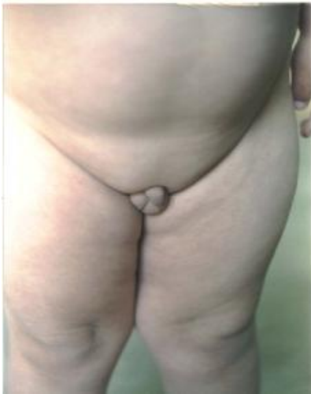
تصویر شماره 3- هیپوگنادیسم

خویشاوندان مبتلا ازدواج خویشاوندی به جز مورد والدین بیمار دیده شد. چاقی و فشار خون بالا در بین والدین و خویشاوندان مشترک مادری و پدری بیمار شیوع بالایی دارد. شواهد حاکی از هتروزیگوت ناقل بودن والدین برای ژن معیوب می باشد. از آنجا که ریسک تکرار بیماری برای فرزندان بعدی 25% میباشد، لذا توصیه های لازم به والدین صورت گرفت.