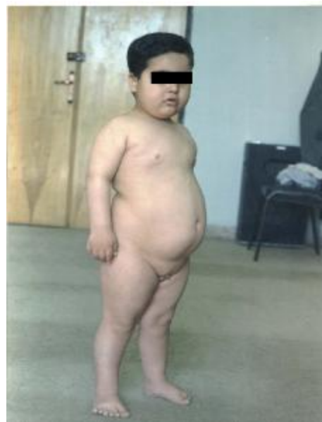
تصویر شماره 2- چاقی، هیپوگنادیسم، پلی داکتیلی در انگشت پای راست