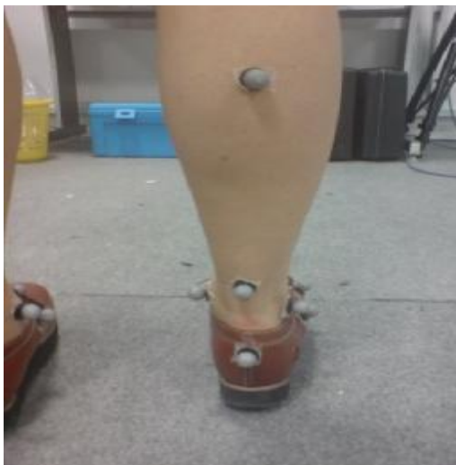
شکل شماره 1- محل قرارگیری مارکرها از نمای خلفی

برای هر آزمونی از 12 عدد نشانگر استفاده شد: سه عدد روی ستیغ استخوان درشت نی، یک عدد پشت ساق روی بالک عضلانی عضله گاستروکنمیوس، یک عدد روی تاندون آشیل، یک عدد در پشت پاشنه، دو عدد روی قوزک داخلی و خارجی و چهار عدد روی سر متاتارس اول و پنجم و پایه متاتارس اول و پنجم که در شروع آزمون نشانگرها در نقاط مورد نظر چسبانده شدند. برای قرار دادن نشانگرها روی سر و پایه متاتارسها سوراخهایی به قطر یک سانتی متر در این نقاط روی کفش ایجاد گردید (شکل 1).