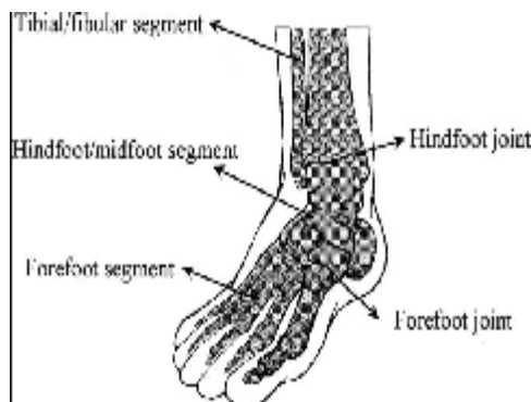
شکل شماره 2-مدل بیومکانیکی سه سگمانی

خلفی پا بین سگمان درشت نی-نازک نی و سگمان میانی پا-خلفی پا و مفصل قدامی پا بین سگمان میانی پا-خلفی پا و سگمان قدامی پا قرار دارد(3).