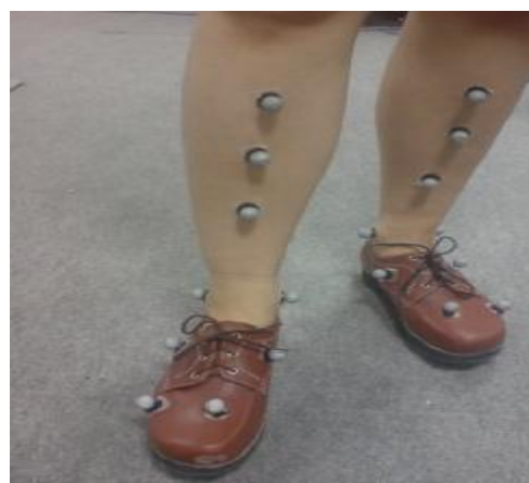
شکل شماره 1-محل قرارگیری مارکرها از نمای قدامی

حرکات سگمان خلفی پا نسبت به سگمان درشت نی-نازک نی در سه صفحه ساژیتال، فرونتال و عرضی (شکل 3): به‌طور کلی در طول یک سیکل کامل راه رفتن، میانگین دامنه حرکتی سگمان خلفی پا نسبت به سگمان تیبیا-فیویلا هنگام استفاده از کفش راکر در مقایسه با کفش معمولی در صفحه ساژیتال کاهش یافت ( p=0/005 ). این کاهش در مراحل ابتدایی ( p=0/005 ) و انتهایی ( p=0/009 ) فاز ایستایی معنی‌دار شد ولی در سایر مراحل سیکل راه رفتن تفاوت معنی‌داری مشاهده نشد. میانگین دامنه حرکتی این مفصل در صفحه فرونتال افزایش یافت ( p=0/028 ) که فقط در مرحله انتهایی فاز ایستایی معنی‌دار شد ( p=0/037 ) و در سایر مراحل سیکل راه رفتن تفاوت معنی‌داری مشاهده نشد. در صفحه عرضی اختلاف میانگین دامنه حرکتی با استفاده از کفش اصلاح شده معنادار نشد ( p=0/203 ).