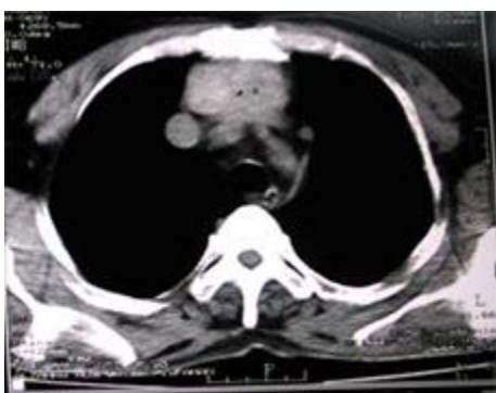
شکل شماره 2- توده بافت نرم در مدياستن قدامی فوقانی در سی تی اسکن

در سی تی اسکن انجام گرفته از قفسه صدري یک توده بافت نرم به ابعاد 60 \times 40 \times 85 mm در مدياستن قدامی فوقانی در قدام تراشه و در خلف استرونوم با گسترش تا حد کارینا گزارش گردیده است. شکل (2).