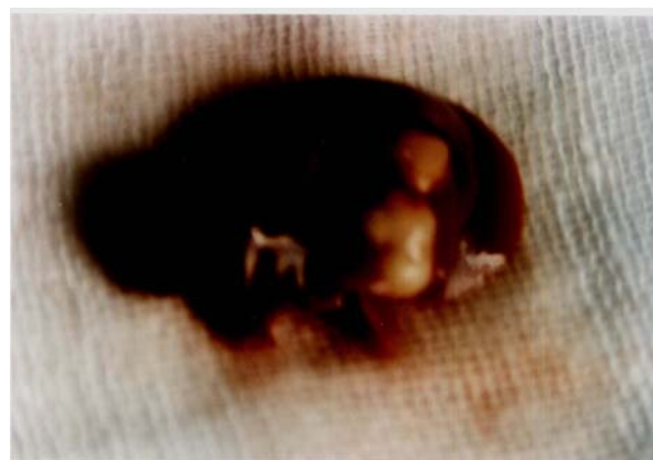
عکس (۱) کیست هیداتید ثانویه دریافت کبد موش سوری ، ماه پنجم آلودگی .