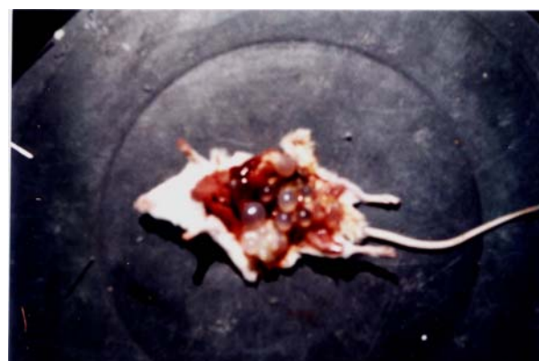
عکس (۲) کیست هیداتید در محوطه شکمی موش سوری (۱۴ کیست) ماه نهم آلودگی .

سینگ ۸ (۱۹۷۶)، از پروتواسکولکس گوسفندی و رائو ۹ (۱۹۸۵)، از پروتواسکولکس گاوی در موش تزریق کردند که نتیجه مثبت بود (۸،۹). هیت ۱۰ (۱۹۷۰)، با استفاده از پروتواسکولکس کیست اولیه کبد و ریه گوسفند استرالیایی و تزریق داخل صفتی به استرین های مختلف موش سوری نتیجه می گیرد که موش سوری حیوان مناسبی برای ایجاد کیست هیداتید ثانویه می باشد (۶).