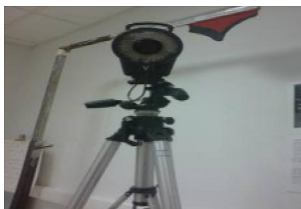
تصویر ۴. نمای قدامی دوربین مادون قرمز وایکان