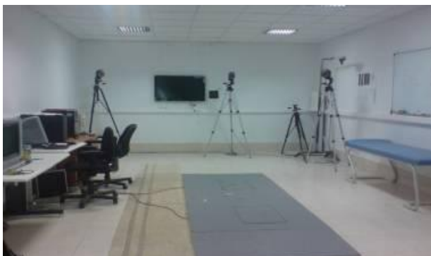
تصویر ۲. نحوه قرارگیری دوربین‌ها و صفحه نیرو در آزمایشگاه بیومکانیک

ارگونومی دانشگاه علوم بهزیستی و توانبخشی گردآوری شد (تصاویر ۲-۴).