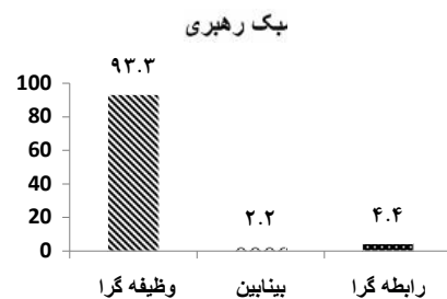
نمودار ۲: توزیع درصدی مربوط به سبک رهبری مدیران

۹۳/۳۳ درصد مدیران از سبک رهبری وظیفه گرا استفاده می کنند، ۴/۴۴ درصد سبک رهبری رابطه گرا را بکار می برند و ۲/۲۲ درصد نیز سبک رهبری بینابین را مورد استفاده قرار می دهند.