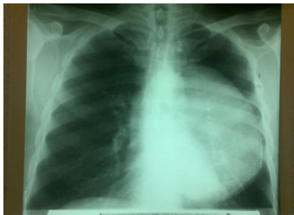
شکل ۱- نمای رخ ونیم رخ گرافی صدی که توده ای را در لوب تحتانی نشان می دهد

علائم حیاتی (BP:120/80, PR:86, RR:16) در محدوده نرمال بوده و CXR توده ای در لوب تحتانی ریه چپ مشاهده شد شکل (۱).