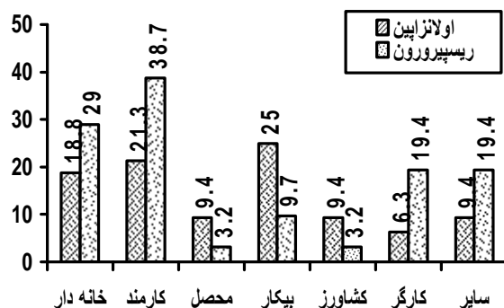
نمودار شماره 2- توزیع فراوانی نسبی واحد در مورد پژوهش در دو گروه اولانزاپین و ریسپریدون بر اساس شغل

نتایج مطالعه حاضر تفاوت معنی داری رادربروز عوارض جانبی مثل کم اشتها، میوکلونوس شبانه، بیخوابی، تعریق، کاهش وزن، ترمور، گالاکتور، حملات خشم، احساس سبکی در سر، پارستزی، بی اختیاری ادرار، سر درد، تهوع، اختلال قاعدگی، یبوست، سرگیجه، خشکی دهان، افت فشار خون وضعیتی، سردرد، عدم تعادل، آکاتژیا، خستگی، لرزش، بوی بددهان و تاری دید در دو گروه بیماران تحت درمان با اولانزاپین و ریسپریدون نشان نداد ( p < 0/05 ).