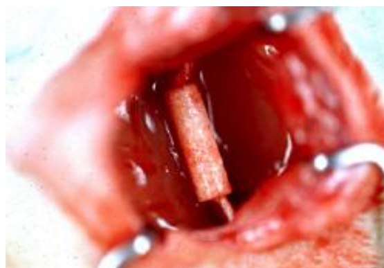
شکل 2: ترمیم شکاف عصب سیاتیک به طول یک سانتیمتر با استفاده از کانال راهنمای عصب

مشکل است: فقدان یک روش استاندارد، شناخت ناکافی اصول مکانیسم های ترمیم عصب، به طوری که در تعدادی از تحقیقات از کانال های به طول کمتر از 10 میلیمتر (12 و 31 و 32)، طول برابر 10 میلیمتر (33 و 34) و طول بیشتر از 10 میلیمتر (8 و 35) استفاده می گردد. حیوانات مورد تحقیق موش سوری (36)، موش صحرايي (33)، خرگوش (31)، میمون (37)، خوکچه هندی (38)، گربه (20) و... است. به عنوان مثال اندازه شکاف ایجاد شده در عصب محیطی، خواص فیزیکی و شیمیایی NGCs به کار برده شده، ویژگی های ماتریکس داخل لوله، ترکیب فاکتورهای رشد عصب که به داخل لوله اضافه می شوند و یا تحت فشار قرار دادن عصب (بدون ایجاد شکاف در آن) بر میزان ترمیم تاثیر دارند. با توجه به روش های مختلف ارزیابی توسط محققین مختلف، مقایسه بین این تحقیقات سخت و دشوار است.