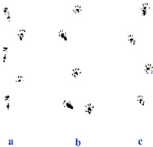
شکل شماره ۱- تصویر اندام عقب (Toes print) موش های گروه های مختلف هنگام راه رفتن جهت اندازه گیری SFI، دوازده هفته پس از ترمیم a) Collagen gel + PVDF b) Autograft c) Control

دهم، مقدار SFI در گروه های آزمایشی تغییر زیادی نداشت (شکل شماره ۱).