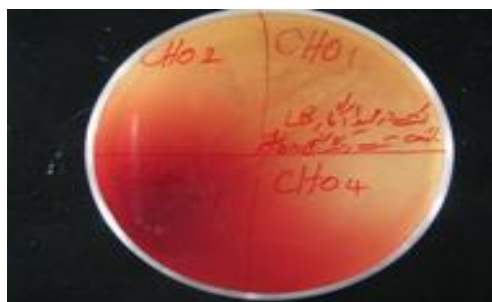
شکل ۳. قرمز شدن محیط کشت در اثر واکنش آنزیم کلاستروول اکسیداز باکتری Rhodococcus sp. 501, 502 با معرف رنگزای HRP.

در آنزیم کلاستروول اکسیداز اولین آنزیم در مسیر تجزیه کلاستروول بوده و یک آنزیم بسیار باارزش در تشخیص کلینیکی و تعیین مقدار کلاستروول خون می باشد. به لحاظ مصرف، بعد از گلوکز اکسیداز دومین آنزیم پرمصرف است (۱۴). از کاربردهای متعدد این آنزیم می توان به تولید پیش سازهای داروهای استروئیدی در صنعت داروسازی، حذف کلاستروول از فرآورده های لبنی و آفت کشی اشاره نمود (۹۱). این آنزیم بطور طبیعی توسط منابع میکروبی مختلفی تولید و ترشح می شود، اما تولید آنزیم بوسیله میکروارگانیسمها به لحاظ کمی بسیار متغیر است و با توجه به میزان مصرف بالای آنزیم و مشکلات مربوط به خالص سازی آن از منابع میکروبی، ژن کلاستروول اکسیداز از گونه های متعدد میکروبی توسط محققین زیادی جداسازی