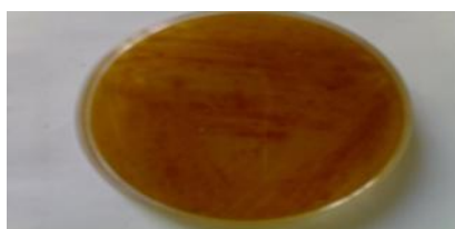
شکل ۲. قهوه ای شدن محیط کشت توسط باکتری های Rhodococcus sp.501,502 مولد آنزیم کلاستروکسیداز.

گزارش گردید که حاکی از اکسید شدن و استفاده کلاستروکسیداز توسط باکتری جدا شده بود. (شکل های ۲ و ۳).