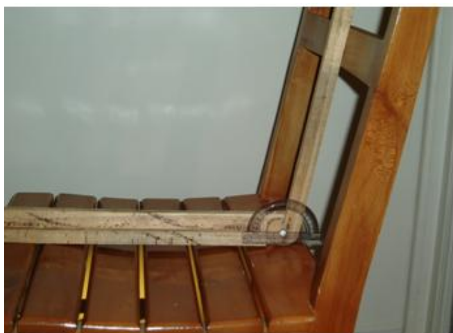
شکل شماره 1- چگونگی اندازه گیری زاویه پشتی صندلی

سالن های مطالعه خوابگاه ها که افراد با لباس راحت و بدون کفش به مطالعه می پردازند استفاده کرد. برای سالن های مطالعه دانشگاه که دانشجویان با لباس رسمی حاضر می شوند باید به میزان 3 سانتی متر به عدد مذکور برای جبران پاشنه کفش اضافه کرد. بنابراین ارتفاع نشیمنگاه صندلی برای سالن های مطالعه دانشگاه با ید حداکثر 41 سانتی متر در نظر گرفته شود. از آنجایی که در متون ذکر شده که ترجیحاً زیر ران کمی بالاتر از لبه جلویی صندلی قرار گیرد می توان 1 سانتی متر از مقادیر مذکور کم کرد. یعنی در نهایت ارتفاع نشیمنگاه صندلی برای خوابگاه ها 37 سانتیمتر و برای دانشگاه 40 سانتیمتر باید در نظر گرفته شود.