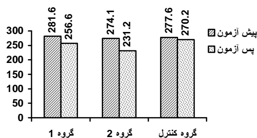
نمودار شماره 1- تغییرات سطوح TG

بر اساس نظر ویلیام و همکاران برای مطالعه آثار سودمند تمرین بر LDL لازم است اجزای آن نیز اندازه گیری شود. بر اساس گزارش او تمرین منظم همراه با کاهش وزن موجب افزایش میزان شناوری LDL و قطر نهایی ذره LDL می شود و تراکم توده ای LDLهای کوچک پلازما کاهش می یابد. با وجود چنین سازگاری هایی، میانگین سطوح LDL پلازما ممکن است بدون تغییر باقی بماند.