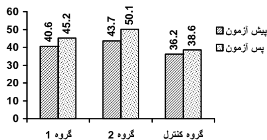
نمودار شماره 3- تغییرات سطوح HDL