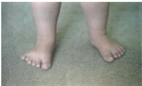
تصویر شماره 4- پلی داکتیلی در انگشتان پای راست، سینداکتیلی در انگشتان 2 و 3 پای چپ