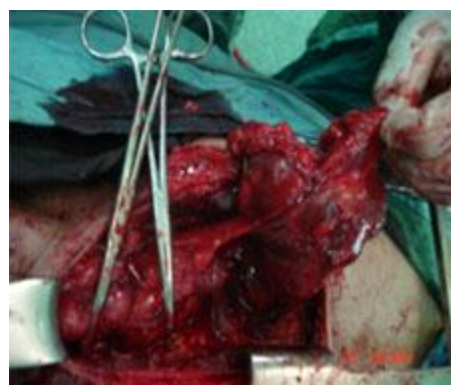
شکل شماره 4- خونگیری توده در محل تیموس در مدیاستن قدامی از عروق داخل قفسه صدی از شریان

در بررسی های قبل از عمل اکو قلب در محدوده نرمال (EF=60) قرارداد و اسپیرومتری نمای انسدادی را مطرح کرده بود. آزمایشات قبل از عمل Hb-CBC- هورمونهای تیروئید، TSH-LDH-aFP-HCG و الکترولیت ها نرمال بودند. بیمار تحت عمل جراحی با برش T در گردن و استرنوتومی نسبی قرار گرفت که در بررسی تیروئید لوب راست به صورت ندول بزرگ بود لوب چپ تقریباً در حد نرمال بود و یک توده به ابعاد 85×60×60 در محل تیموس در مدیاستن قدامی وجود داشت که خونگیری آن از عروق داخل قفسه صدی از شریان و ورید بی نام بود که (شکل 4 و 5) در بررسی پاتولوژی از بیمار گواتر مولتی ندولر کیستیک گزارش گردید شکل (6). در follow up چهار ماه بعد کلیه علائم بیمار از بین رفته بود