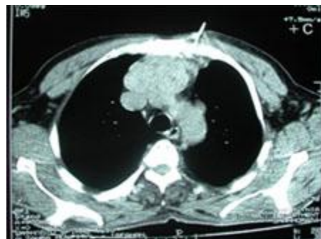
شکل شماره 3- گواتر مولتی ندولر در گردن

در بررسی با اسکن تیروئید گواتر مولتی ندولر در گردن جدا از توده مدیاستن گزارش شد. در بیوپسی با گاید سی تی که انجام شد گواتر مولتی ندولر گزارش گردید. شکل (3).