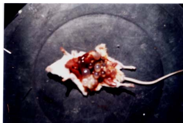
عکس (۲) کیست هیداتید در محوطه شکمی موش سوری (۱۴ کیست) ماه نهم آلودگی.

سینگ ۸ (۱۹۷۶)، از پروتواسکولکس گوسفندی و رائو ۹ (۱۹۸۵)، از پروتواسکولکس گاوی در موش تزریق کردند که نتیجه مثبت بود (۸،۹). هیت ۱۰ (۱۹۷۰)، با استفاده از پروتواسکولکس کیست اولیه کبد و ریه گوسفند استرالیایی و تزریق داخل صفتی به استرین های مختلف موش سوری نتیجه می گیرد که موش سوری حیوان مناسبی برای ایجاد کیست هیداتید ثانویه می باشد (۶).